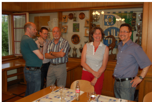
kleiner Plausch am Rand der Versammlung

Der Antrag des Vorstandes zur Änderung der Statuten wurde angenommen. Die neuen Statuten und das überarbeitete Bussen- und Spesenreglement werden zusammen mit diesem „BCL-aktuell“ an die Mitglieder versandt.